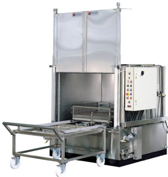
Станок для промывки посредством орошения, При 10% разведении в воде

iBiotec® Tec Industries®Service Z.I La Massane - 13210 Saint-Rémy de Provence – France Tél. +33(0)4 90 92 74 70 – Fax. +33 (0)4 90 92 32 32 www.ibiotec.fr