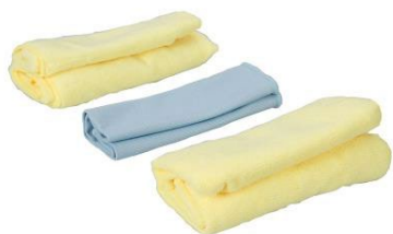
Обезжиривание при помощи тряпки