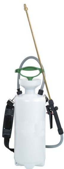
Пульверизаторы низкого давления с промывкой водой При 20% разведении в воде