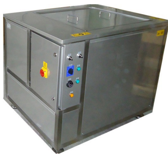
Ультразвуковые резервуары при 10% разведении в воде